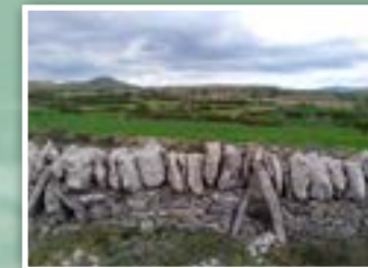
2.- Cerradas de piedra seca