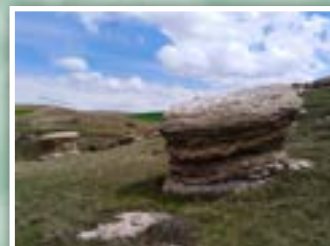
7.- Modelado kárstico