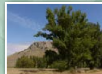
10.- Chopos cabeceros y Cabezó del Calarizo