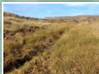
9.- Prados frescos en el cauce del río