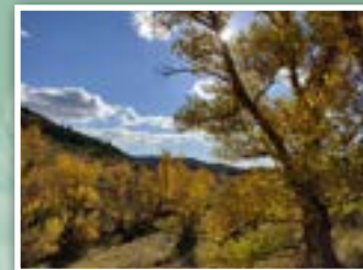
1.- Arroyo de la Tejería