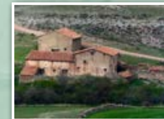
4.- Mas de la Cavada