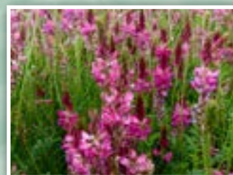
5.- Pipirigallo en flor