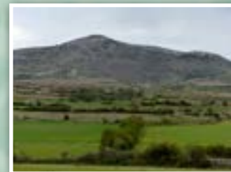
3.- Paisaje en bocage