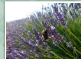
8.- Floración de los cultivos de lavanda