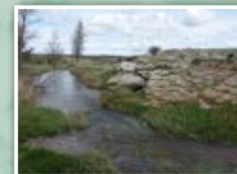
6.- El río Seco en primavera